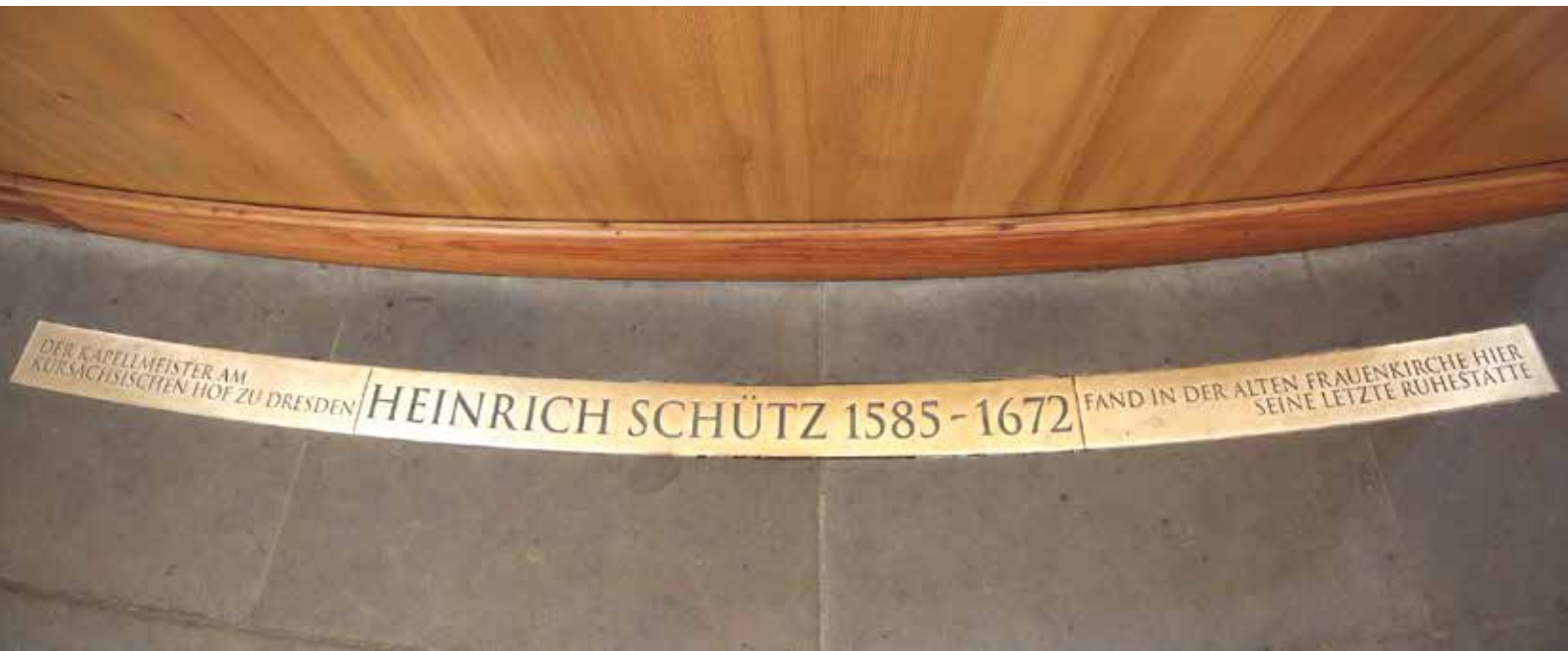
Inschrift im Fußboden der Dresdner Frauenkirche, gestaltet von Einhart Grotegut, 2006.

Erbgrabnisse an der Fassade der Frauenkirche und an der Kirchenmauer mit Epitaphien für 284 Personen. Im dritten Teil werden 820 Grabdenkmäler beschrieben, die sich unter freiem Himmel auf dem Friedhof befinden.