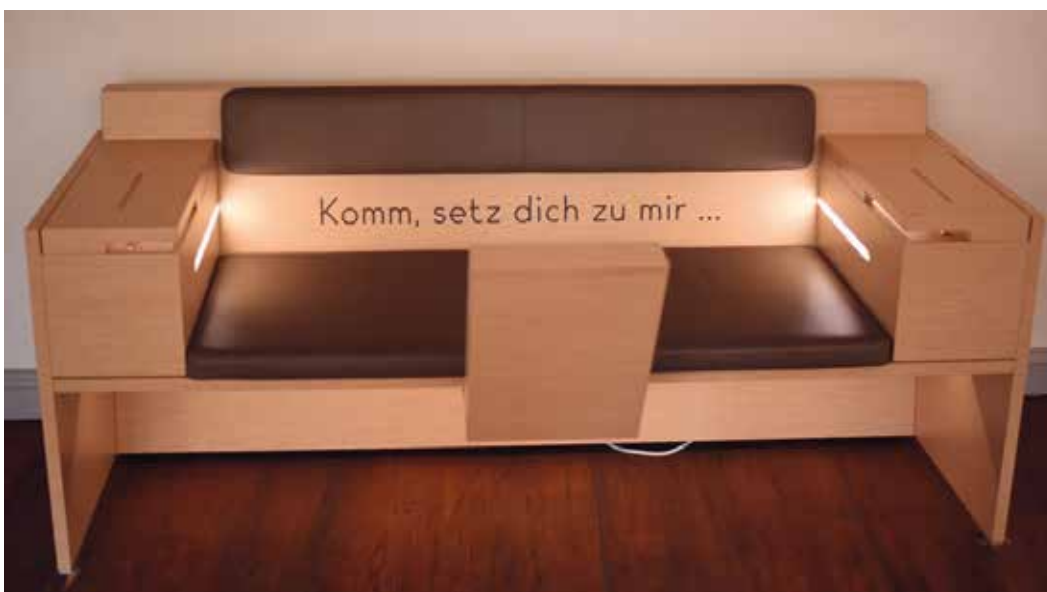
Heinrich-Schütz-Haus in Weißenfels, eines von vier Schütz-Sofas in den Ausstellungsräumen