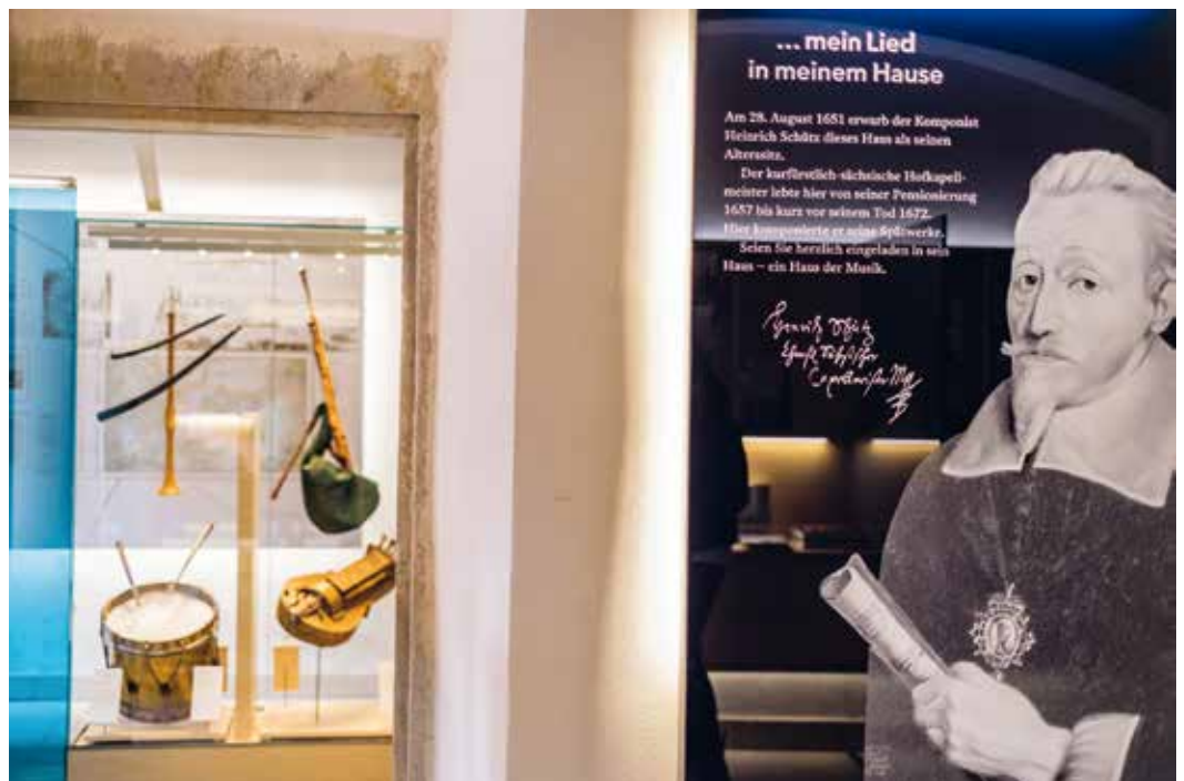
Heinrich-Schütz-Haus in Weißenfels, Blick vom Eingangsbereich in den ersten Ausstellungsraum