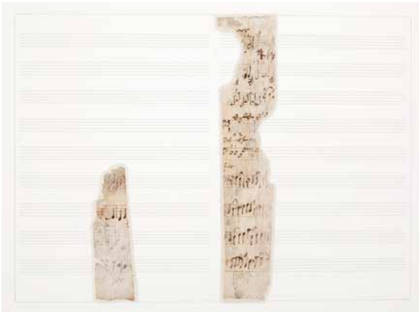
Heinrich-Schütz-Haus in Weißenfels, autographe Notenfragmente Schützens aus einer verschollenen Vertonung des 10. Psalms

Hörspiel in der WebApp des Heinrich-Schütz-Hauses Weißenfels