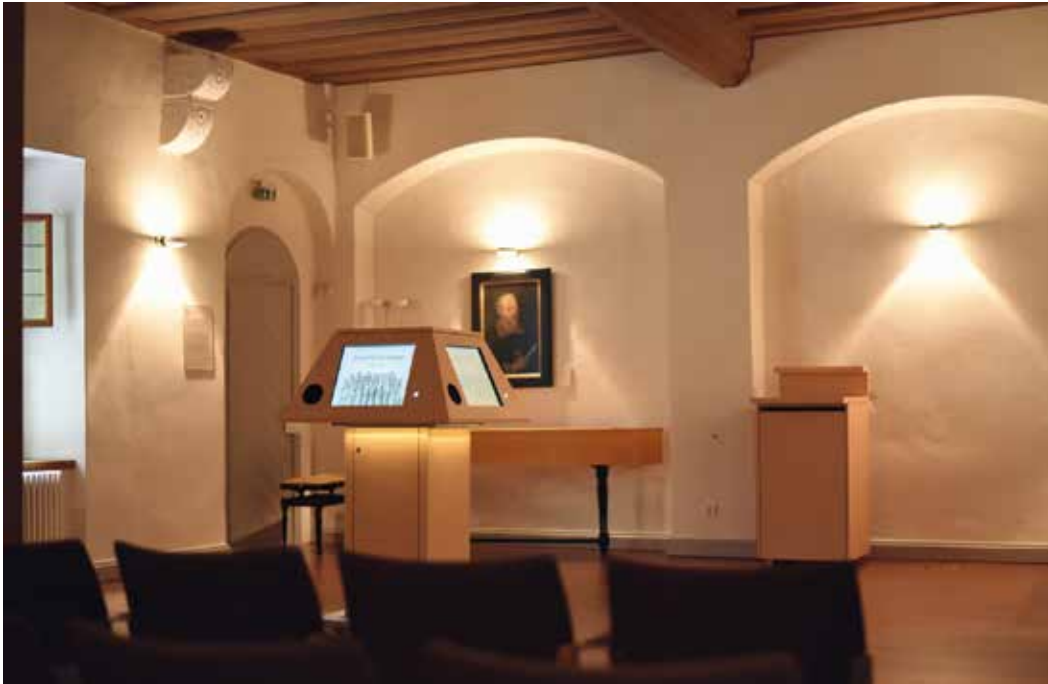
Heinrich-Schütz-Haus in Weißenfels, Singendes Notenpult im Konzertsaal des Hauses

seinen gewesenen Discipel, geschrieben [hatte], mit Bitte ihm seinen Leichentext: Cantabilis mihi erant justificationes tuae in loco peregrinationis meae [Vulgata, Psalm 118, Vers 54], nach dem praesentischen Contrapunctstyl, mit 2 Cant[i]. A[ltus]. T[enor]. & B[assus]. auszuarbeiten: welch Motete er denn, zwey Jahr vor seinem Ende, A[nno]. 1670. empfangen, und ein großes Vergnügen darüber bezeuget hat.“ Bernhards Trauermotette ist zwar nicht mehr erhalten, dafür aber drei Traktate, die er veröffentlichte und die die Lehrmethoden Schützens in den Bereichen Gesangs- und Figurenlehre, Satzlehre und Kompositionslehre widerzuspiegeln scheinen. 11 Zu den Schütz-Schülern darf man getrost auch Herzogin Sophie Elisabeth von Braunschweig-Lüneburg (1613–1676) zählen, an deren Hof in Wolfenbüttel Schütz sich im Herbst/Winter 1644/45 aufhielt, wie aus zwei Briefen Schützens an die