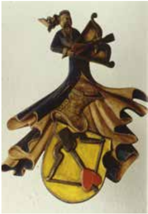
Familie Schütz, Wappen des bürgerlichen Zweigs