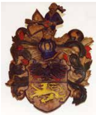
Familie Schütz, Wappen des adeligen Zweigs