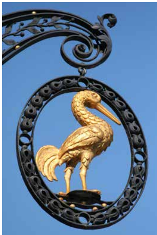
Ausleger des Gasthofs „Goldener Kranich“, heute Heinrich-Schütz-Museum

Seit 1985 haben wir in seinem Geburtsort „Ein ganzes Haus für Heinrich Schütz“ – wie damals in der Zeitung stand. In kürzester Zeit aus dem Boden gestampft, ohne Archiv, ohne Bestand, ohne eigene Exponate... Und trotzdem: Eine vielgestaltige Ausstellung führte in Leben und Werk