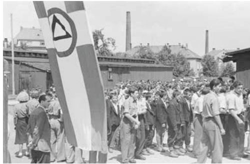
Griechische Kinder bei einer Kundgebung in Bischofswerda, 9. Juli 1950

Trotz der geografischen Entfernung kamen in mehreren Epochen und aus ganz unterschiedlichen Gründen Griechen nach Sachsen. Ende des 18. Jahrhunderts förderte die sächsische Regierung den Zuzug von Kaufleuten mazedonischer Herkunft, die man als „Griechen“ bezeichnete. Diese brachten Baumwolle nach Sachsen und stellten somit die Zufuhr des wichtigsten Rohstoffes der Frühindustrialisierung sicher, wie Sebastian Liebold anhand der „Chemnitzer Griechen“ erklärt. Bemerkenswert ist, dass diese Kaufleute – als Mittel der Wirtschaftsförderung – in den Reichsadelsstand erhoben wurden, darunter die Familie von Karajan. Mehr als einhundert Jahre später wurde im Ersten Weltkrieg ein griechisches Armeekorps ins Deutsche Reich evakuiert und in Görlitz untergebracht – wo einige von ihnen auch nach Kriegsende blieben. Von