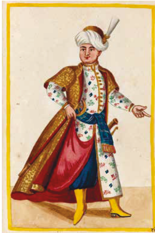
Christian Ehrenfried Kayser: „Kammertürke“, Wasser- und Deckfarben auf Papier, 1719 Staatliche Kunstsammlungen Dresden, Kupferstich-Kabinett, Ca. 100, Bl. 67.

Madame Spiegel verbrachte ihre letzten Lebensjahre in Polen. Mehrfach besuchte sie das Kloster der Barmherzigen Brüder vom heili-