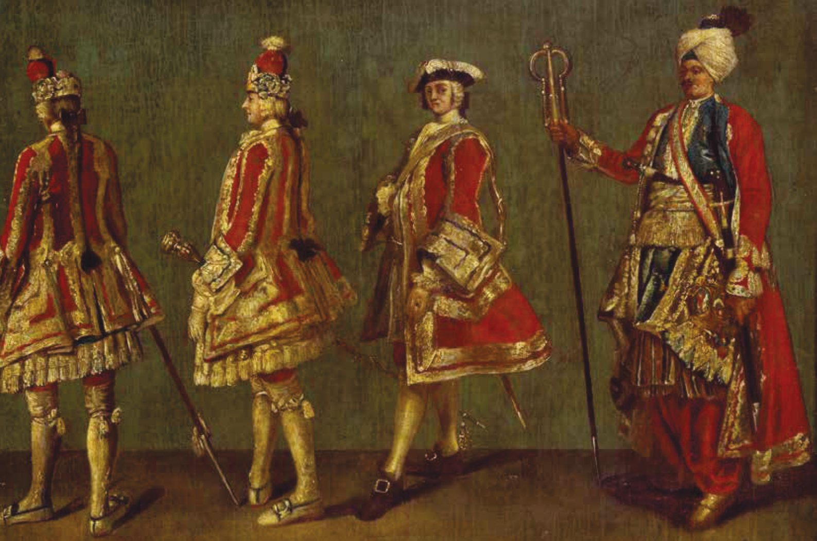
Bedienstete des Grafen Heinrich von Brühl, rechts der „Kammertürke“ des Premierministers, Figurenstudie, Öl auf Leinwand, 1747 Staatliche Kunstsammlungen Dresden, Gemäldegalerie Alte Meister, Inv.-Nr. Mo 1167