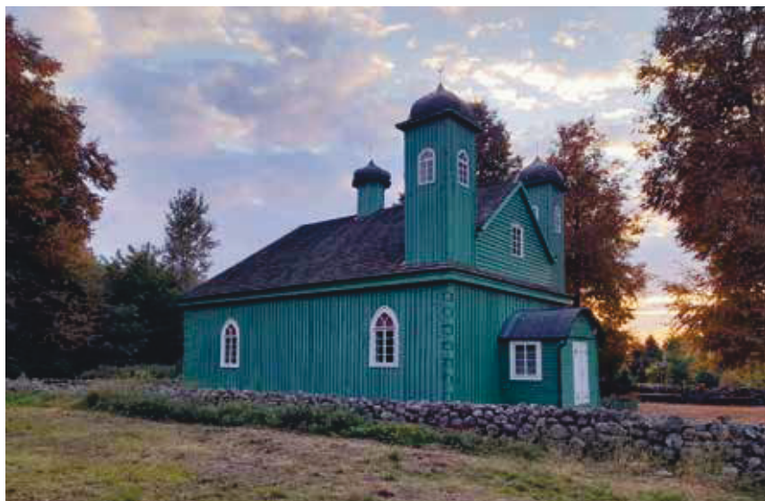
Tatarische Moschee in Kruzyniany

August der Starke herrschte als König von Polen auch über muslimische Untertanen. Die Großfürsten von Litauen hatten seit dem frühen 14. Jahrhundert Tataren der Goldenen Horde, also Angehörige von Turkvölkern mit islamischem Glauben, in Litauen angesiedelt. 57 In dem weit nach Osten ausgreifenden Großfürstentum Litauen erhielten sie Glaubens- und Verwaltungsfreiheit. Diese Rechte blieben auch nach dem Übertritt des Großfürsten Jogaila zum römisch-katholischen Glauben und seiner Annahme der polnischen Königskrone bestehen. Die Tataren nannten sich selbst „Lipka-Tataren“ (Litauen-Tataren) und siedelten überwiegend im Gebiet um Białystok, Grodno, Kaunas, Wilna und Minsk. Aus westlicher Sicht wurden sie als „Tartaren“