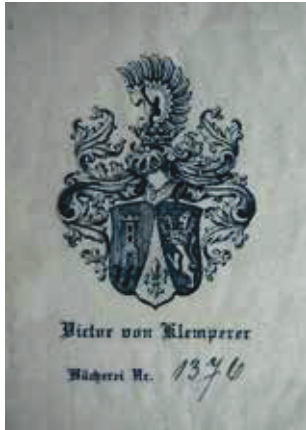
Wappenexlibris des Dresdner Bankiers und Kunstsammlers Victor von Klemperer (1876–1943)

die Chancen eher schlecht, dass dies tatsächlich geschehen könnte.