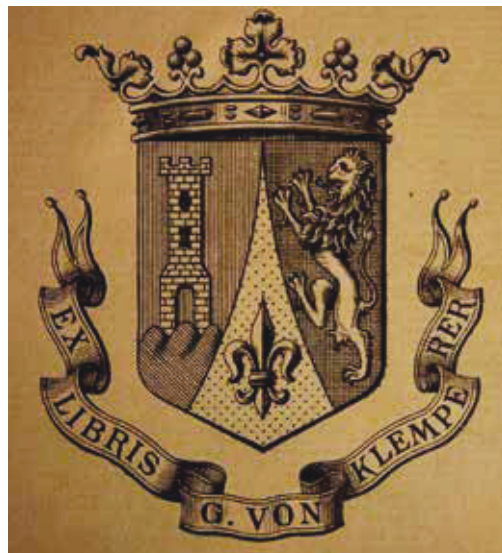
Wappenexlibris des Dresdner Bankiers Gustav von Klemperer (1852–1926)

In Dresden hatte die Familie von Kaskel lange Zeit standesgemäß in dem von Semper im Neorenaissancestil errichteten Palais Oppenheim an der Bürgerwiese sowie im Barockschlösschen „Antons“ am linken Elbufer, gegenüber dem Waldschlösschen, gelebt. Seit Jahren wird diskutiert, ob das 1945 ausgebrannte und erst 1951 abgerissene Palais rekonstruiert werden soll; momentan stehen