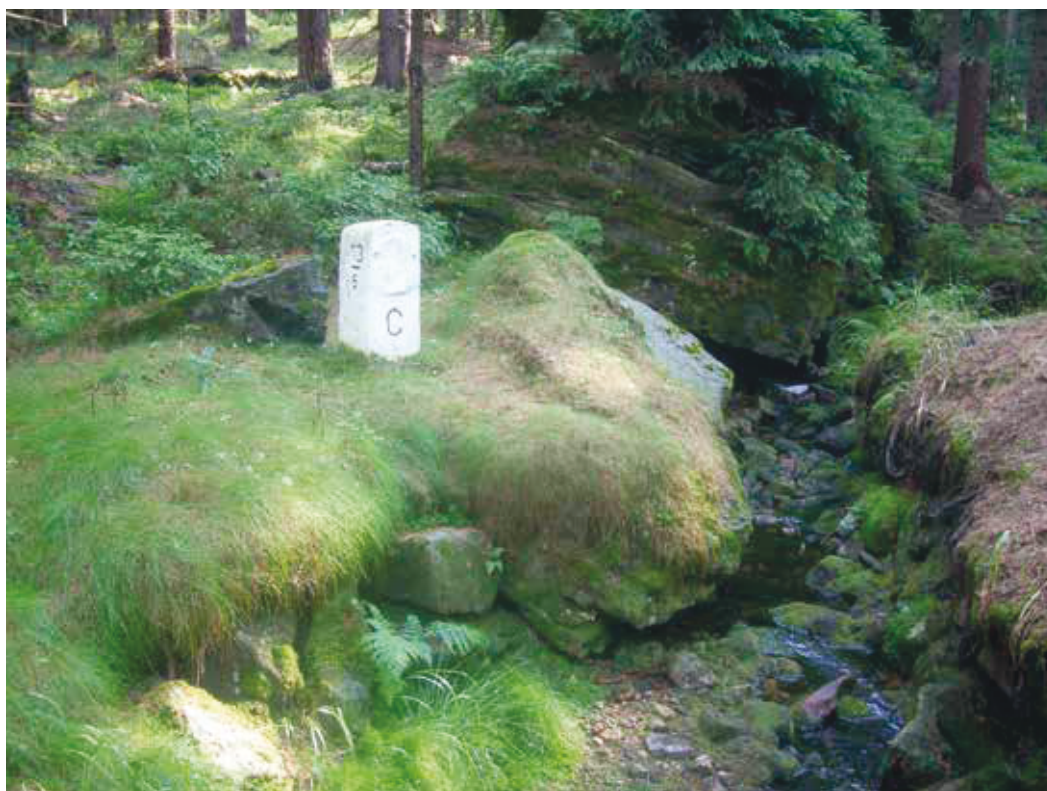
Grenzstein an der sächsisch-böhmischen Grenze

Die größte Dynamik der Bevölkerungsbe- wegungen wiesen in den 1850er Jahren die Kreisdirektionsbezirke Leipzig und Zwickau auf; den umfangreichsten Zuzug darunter der Kreisdirektionsbezirk Leipzig, die größte Abwanderung der Kreisdirektionsbezirk Zwickau. In den anderen beiden Bezirken Dresden und Bautzen hielten sich Ein- und Auswanderung in etwa die Waage. Eine Statistik dieser Zeit bietet einen tieferen Einblick in die Wanderungsverhältnisse der einzelnen sächsischen Orte bzw. Gerichtsämter. 16 In beide Richtungen (Ein- wie Auswanderung) besaßen die drei bevölkerungsreichsten Städte die größte Dynamik. Besondere Attraktivität für Zuwandernde wiesen Leipzig (1.109 Personen), Dresden (330), Chemnitz (175), gefolgt von Löbau (161), Wurzen (146), Bautzen (133), Zittau (130), Großenhain